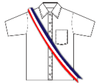
Ilustración 3: Forma correcta de usar los colores en la Cinta de Cuadro de Honor