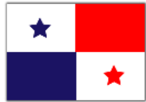
Ilustración 1: Forma de colocar la bandera en la asta

El objetivo de esta selección de colores fue la de unificar al pueblo de Panamá, que quedó dividido durante la Guerra de los Mil Días y necesitaba olvidar sus diferencias y seguir adelante como un Estado independiente.