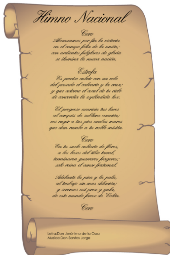
Ilustración 7: Himno Nacional de Panamá

El Primer Grito de Independencia en la Villa de Los Santos se conoce al hecho ocurrido el 10 de noviembre de 1821 en Panamá, en la que ocurre un alzamiento popular en contra del gobierno colonial español en La Villa de Los Santos en la Provincia de Los Santos; según la tradición popular, este hecho fue encabezado por Rufina Alfaro, aunque históricamente no está comprobado plenamente. Aún así este hecho desencadenó una serie de Gritos de Independencia en varias ciudades panameñas, culminando con la Independencia de Panamá de España, el 28 de noviembre de 1821.