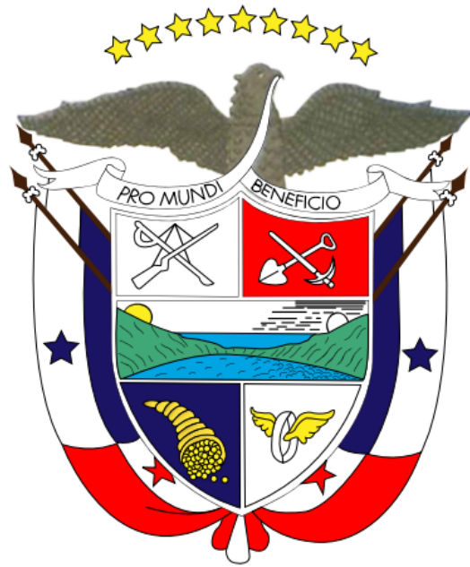
Ilustración 6: Escudo Nacional de Panamá

El Escudo de Armas de la República tiene la descripción siguiente: descansa sobre campo verde, símbolo de vegetación, de forma ojival terciada en cuanto a la división. El centro y punto de honor del Escudo muestra al istmo con sus mares y su cielo en el cual se destacan la luna que comienza a elevarse sobre las ondas y el sol que comienza a esconderse tras el monte, marcando así la hora solemne de nuestra separación de Colombia.