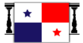
Ilustración 2: Forma de colocar la bandera en un balcón